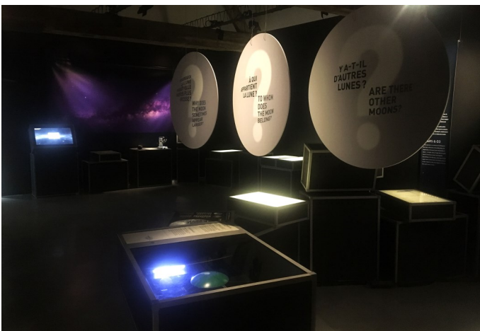
Une nuit dans le ciel