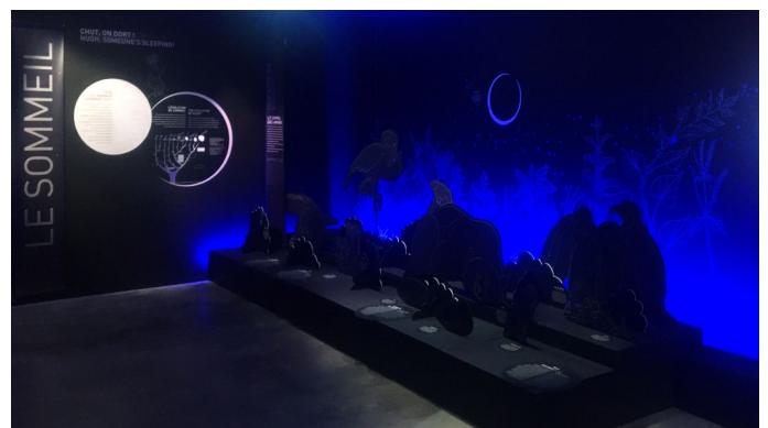
Une nuit de sommeil