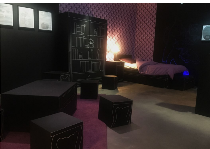
Une nuit de sommeil