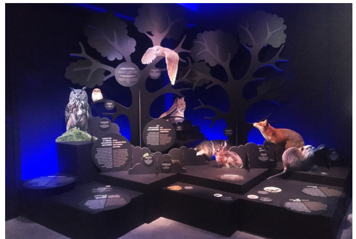
Une nuit dans la nature