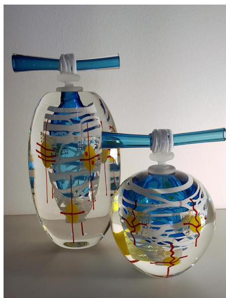
Hum2, Hum5