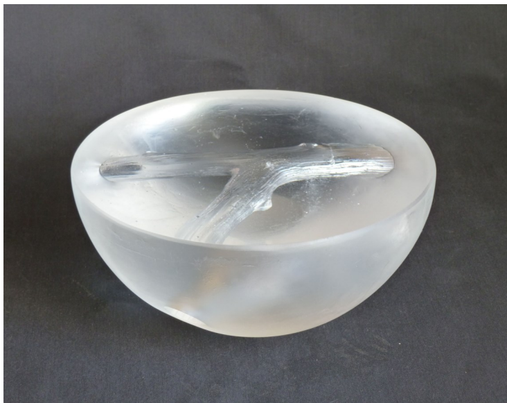
Fork © Céline Tilliet

Pour cela, au sein d'un éventail de techniques et de matériels, une sélection doit être opérée afin de trouver celle le plus à même de restituer l'idée maîtresse. »