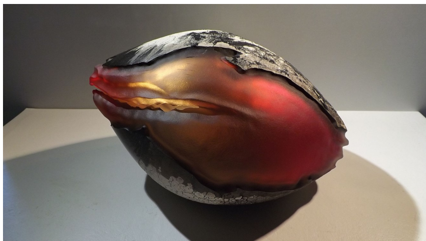
Galet rouge