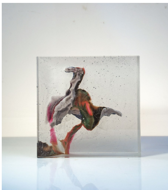
Chair et Os X © Antoine Leperlier