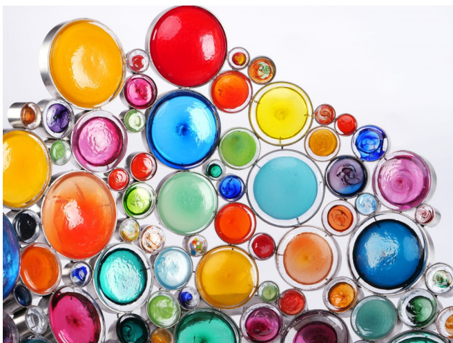
Détail Crapaud