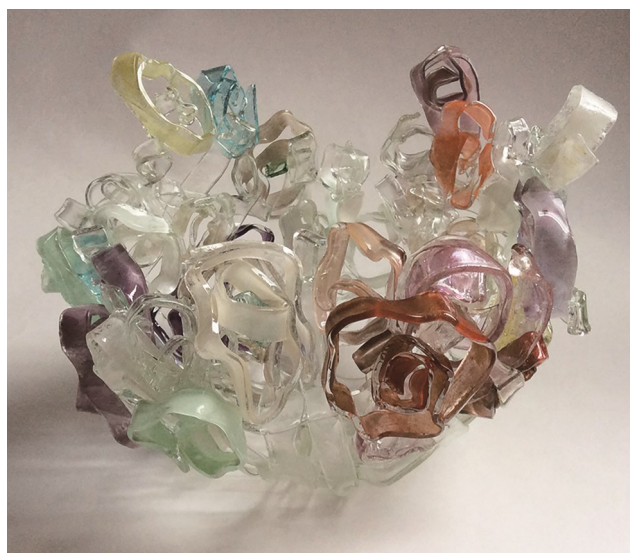
Parfum © Kazumi Taiï

Plasticienne et verrier, de nationalité Japonaise, elle expose en France et en Europe. Elle obtient en 2010, le prix du public au Concours FIMA de Baccarat en France.