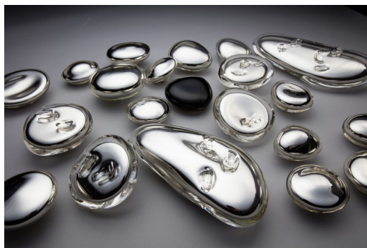
Retracer © Anne Donzé et Vincent Chagnon