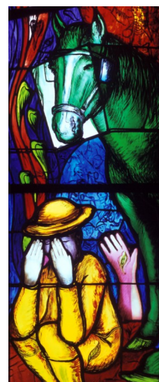
Détail vitrail « Grisou d'enfer » © Carmelo Zagari Faymoreau