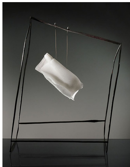
Séchoir au vague © Michel Lagrange

www.artistescontemporains.org/artistes/m-d-lagrange